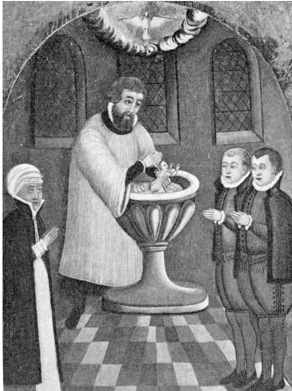
Landet kirke, Lolland

I denne Anvisning, som Peder Palladius udsendte 1538 hedder det: "Når Liget er da kommet til Graven, saa lægger man det straks neder, og Præsten kaster tre Skovfulde Jord derpaa med disse Ord: Af Jord er du; og til Jorden er du kommen; men Gud vil oprejse dig paa den yderste Dag ", saa lader han skyde Graven til, og da gør han en føje Formaning. Om denne Form samler man sig da i de følgende Aar, hvor man arbejder paa at befri sig for katolske Levn ved at lade Liget begrave før Tale og øvrig Tjeneste og ved, som paa Roskilde Landemode 1554 at