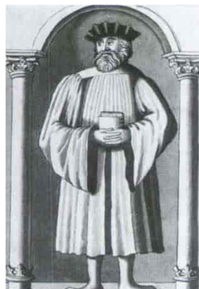
Peder Palladius (1503 - 1560)

Vi hører ham tale forstaaende og alvorligt til disse unge Piger i Sognet, om deres Forhold i Hjem og Tjeneste og deres Forhold som tugtige Piger overfor Forførere: "est du en god Pige og vil bære din Urtekrans om Sommeren paa dit Hoved med Hæder og Ære, da skal du før alle dine Negle sidde kendt udi saadan en Skalks Ansigt, at han kan sige, han har været der, førend han skulde fremme sin Vilje hos dig; det er bedre at du skrammer hannem, end at han skænder dig. – Mærk, hvad jeg siger dig, Pige lille, det gælder dig og ikke mig. "