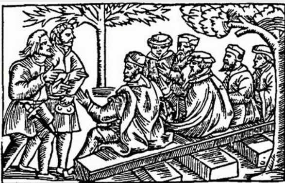
Stokketing. Navnet henviser til de stokke, man sad på.

Forholdet er imidlertid, at naar en Bonde svarede sin Landgilde og opfyldte sine øvrige Pligter, var han urørlig. Han kunde iflg. Olufs Haandfæstning opsige sin Bopæl efter Landsloven, og baade Christiern II's og Frederik I's Recesser sikrer hans Ret, naar han gør sin Skyldighed. Ja, han var Livsfæster , og vi ser, at der i disse Perioder har været stor Rigdom i Bondehjemmene, ogsaa i rent Sølv – en enkelt Bonde kunde efter Clementfejden udløse sig med 1000 M. Penge; deres Gilder var uhyre overdaadige, og et Maaltid, der skulde være blot lidt over det almindelige, krævede Saltmad, tre ferske Retter og Steg med en Tønde Øl for hver 12 Personer. Kongerne var i Reglen meget nøjeregnende, at der ikke skete Bønderne Uret, og de fik Yndest i Almuen derfor; det gjaldt ogsaa Konger som